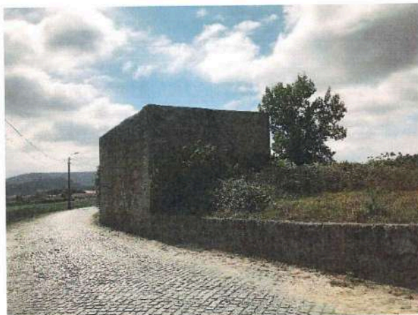
Imagem 1 – Foto onde é visível a edificação caracterizada pelo artigo urbano n.º 45 pelo arruamento público.