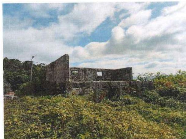
Imagem 2 – Foto onde é visível de outro ângulo a edificação caracterizada pelo artigo urbano n.º 45 sem cobertura e coberta na sua maioria pela vegetação.