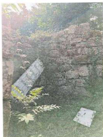
Imagem 3 – Foto da edificação caracterizada pelo artigo urbano n.º 43, onde é visível o interior sem cobertura, bem como acumulação de vegetação no seu interior.