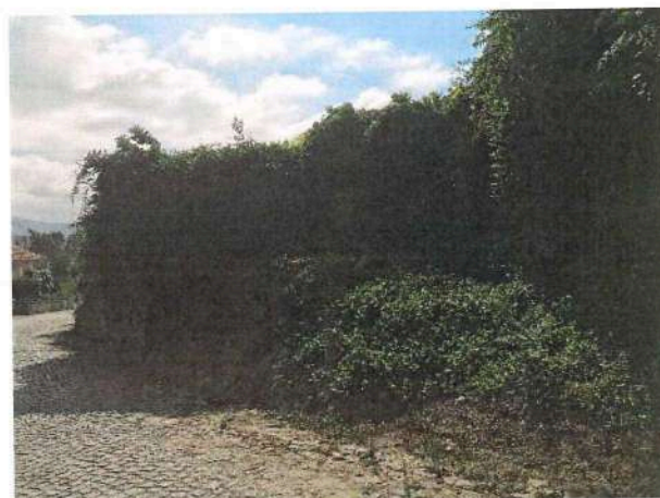
Imagem 4 – Foto da entrada da edificação caracterizada pelo artigo urbano n.º 44, onde é visível a entrada do prédio coberta pela vegetação. A edificação está inacessível dado a existência da densa vegetação e com o auxílio da ferramenta eletrónica Google Maps foi possível verificar a inexistência da cobertura e a densa vegetação na mesma.